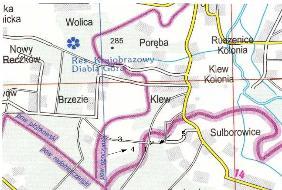
Rys.1. Bitwa pod Diablą Górą z 16 sierpnia 1944 r., I faza (opisana w tekście). Obecny podział administracyjny terenu. Legenda: 1 – pododdział por. „Bończy” i pododdział „Trop” ppor. „Groma”, 2 – pododdział ppor. „Konrada”, 3 – pięciosobowa grupa „Negusa” do likwidacji żandarmów idących i jadących przodem, którzy minęli zasadzkę, 4 – kierunek działania wsparcia OP „Grom” ppor. „Maja”, 5 – kierunek działania npla podczas I fazy bitwy.

ale przeważało mocne natarcie OP „Burza” 11 . Wieczorem Niemcy wycofali się, pozostawiając 66 poległych i około 100 rannych 12 . Partyzanci stracili 10 poległych, a 10 było rannych 13 . Po walce batalion przeszedł w lasy przysuskie, w rejon leśnej wsi Stefanów, aby 21 sierpnia 1944 r. podporządkować się dowódcy korpusu kieleckiego AK płk „Einowi”, „Mieczysławowi” (Janowi Ziętarskiemu), który zamierzał maszerować na pomoc Warszawie, w ramach akcji „Burza”. Dnia 4 września batalion został uzupełniony i przemianowany na 25 pp, a mjr „Roman” zmienił pseudonim na „Leśniak”. Całość korpusu liczy-